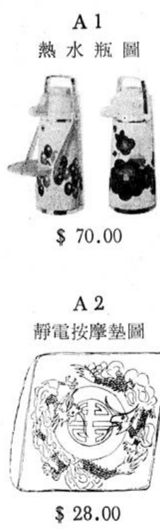
A1 熱水瓶圖 $ 70.00

廉美物品 本會現直接向總代理訂購日本精美新式按壓熱水瓶2.2公升，每只原價105.00元現售70.00元。另有靜電按摩椅墊(Cushion)每只原價42.00元現售28.00元。